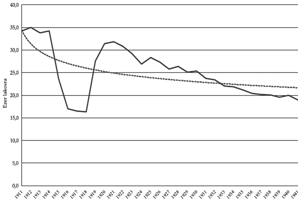
2. ábra. Az élve születések ezer lakosra eső arányának változása a trianoni Magyarország területén, 1910–1941 (Koloh, 2018, 24.)