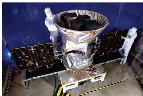
1. ábra. Balra: a Kepler-űrtávcső felbocsátása előtt, az Astrotech titusville-i bázisán;

jobbra: a TESS műhold, szintén nem sokkal a felbocsátása előtt, 2018 áprilisában