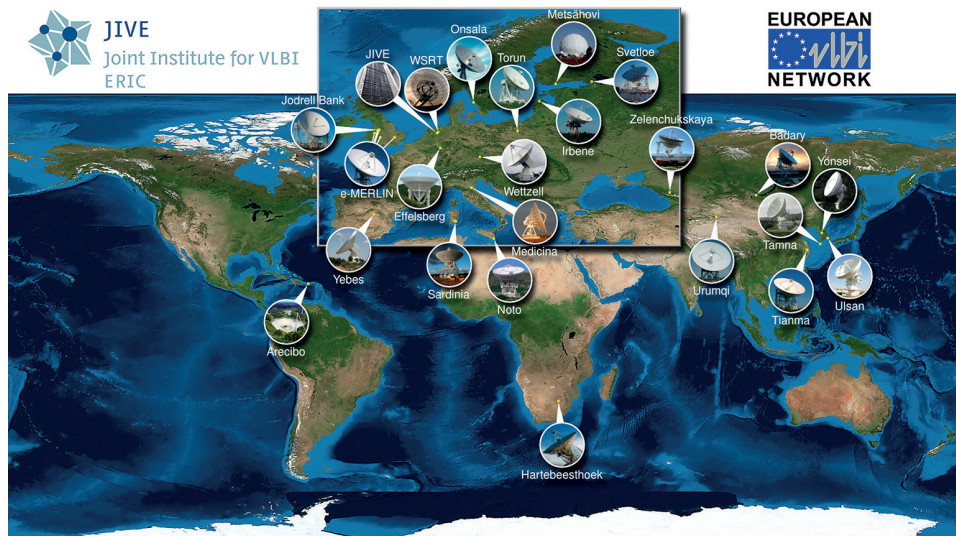
1. ábra. Az Európai VLBI-hálózatban részt vevő antennák (,)

Nevével ellentétben az EVN-hez nemcsak európai, hanem ázsiai és afrikai antennák is tartoznak (1. ábra). Így 6 cm-es hullámhosszon a VLBA-hoz hasonló másfél ezredmásodperces szögfelbontást kelet–nyugati (kínai és európai antennák között) és észak–déli (európai és dél-afrikai antennák között) irányban is biztosít. Emellett az EVN érzékenysége jobb, mint az amerikai hálózaté. Ez a megfigyelésekben részt vevő nagy átmérőjű – például a 100 m-es effelsbergi, a 65 m-es sanghaji és 64 m-es szardíniai – antennáknak köszönhető. (Összehasonlításképpen, a VLBA antennái 25 m átmérőjűek.) A két hálózat együtt is használható mint egyetlen globális interferométer. Emellett az EVN-hez csatlakoztatva lehetőség van ausztrál, dél-koreai és egyedi amerikai antennákkal is kiegészíteni az elérhető bázisvonalak hálózatát.