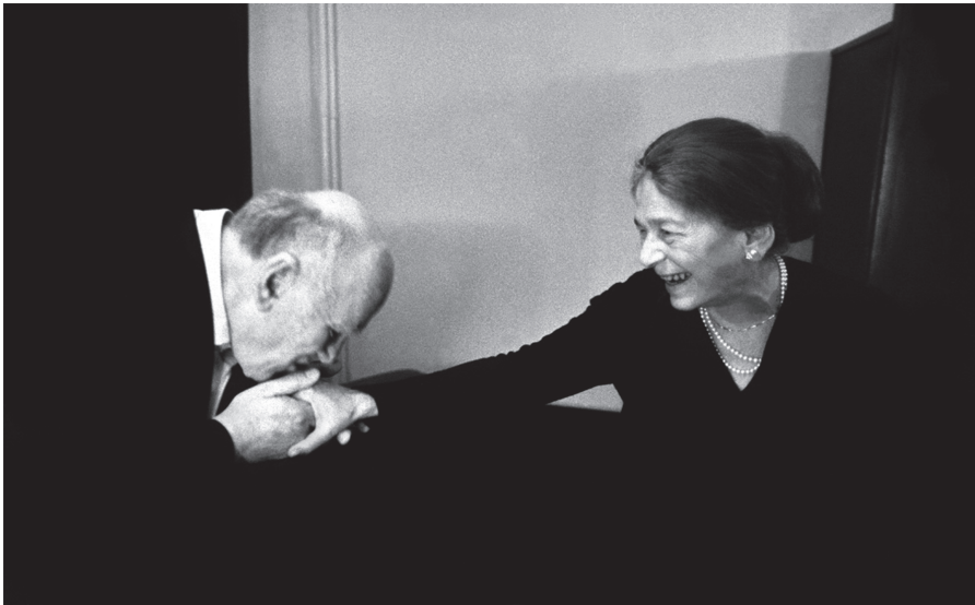
Fischer Annie és Szvjatoszlav Richter