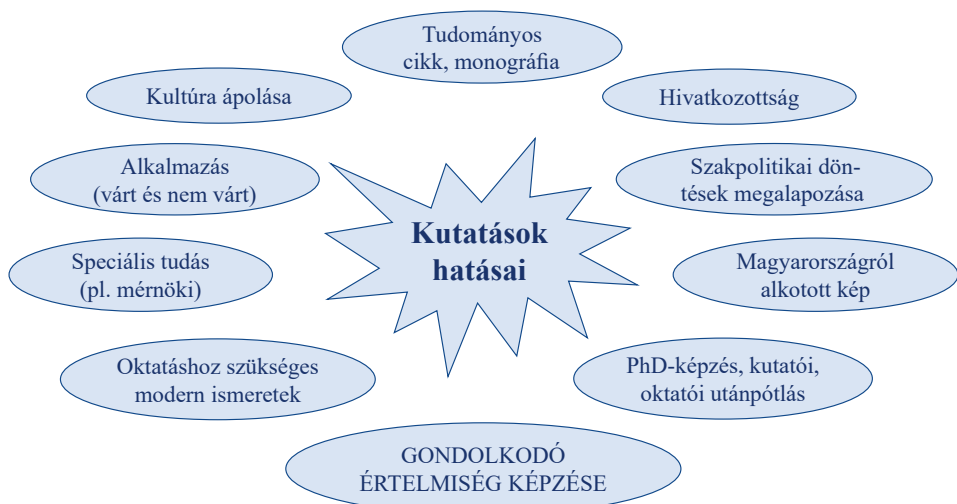
1. ábra. A kutatások eredményei, hatásai

Az egyetemi csoportok eredményességéhez a pályázati sikeresség is hozzájárul, és a támogatás elnyerésénél a pályázó habitusának megítélése mellett az egyik legfontosabb szempont a kutatás várható hatása (impaktja) . Ez a „hatás” azonban igen tágan értelmezhető: lehet tudományos, lehet társadalmi, kulturális, és lehet gazdasági haszon is. A tudományos hatást többé-kevésbé mérik a tudományos művekre adott hivatkozások, a szakmai műhelyek/iskolák elismertsége és a kutatói utánpótlás nevelése, a gazdaságit a tervezett és a nem várt alkalmazá-