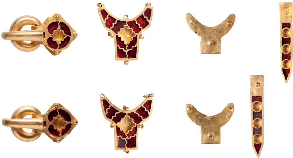
2. kép. Lábbelihez tartozó aranyveretek a Telki mellett feltárt áldozati leletegyüttesből (Szenzthe et al., 2019)

személyes tárgyakkól (arany ruhadíszek, övveretek, lábbeli garnitúrák), fegyverekből, lószerszámdíszekből, edényekből álló leletegyüttesek. Sztyeppei párhuzamaik (kurgánokhoz kapcsolódó lelőhelyek) és a debreceni sírlelet alapján tudjuk őket a temetkezési rituáléhoz kötni. A legtöbb Kárpát-medencei esetben ugyanis nem ismerjük magát a sírt, csupán az utólag – feltehetően a sír közelében – elásott áldozati együttest. A híres Szeged-nagyszéksósi lelet mellett ilyenek kerültek elő Pécs-Üszög, Bátaszék, Pannonhalma és Telki határában is. Ugyanakkor a debreceni lelőhelyen egy késő szarmata sírt körülvevő árokba ásva került elő egy nemesfém- és vastárgyakból álló áldozati lelet. Ebben az esetben tehát egy jól ismert szarmata temetkezési rítushoz kapcsolódik az új, sztyeppei rítuselem, ami a helyi, késő szarmata és a hun-alán elit közti szoros kapcsolatokra utal (Wieszner–Nagy, n. d.). A másik, újonnan felfedezett áldozati együttes a Pest megyei Telkiből már a hun korszak végén kerülhetett földre, valószínűleg a hun uralom felbomlását követően. Ez a lelet arra világít rá, hogy bizonyos körökben még a birodalom szétesése után is fennmaradhatott ez a sajátos, a hun kori előkelő réteg önkifejezését és összetartozását tükröző gyakorlat (Szenzthe et al., 2019) (2. kép).