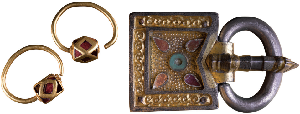
3. kép. Hun kori női sír fülbevaló- és csatlelete Kapolcsról (Fotó: Vágó, 2015, 391. VI/67. kép)