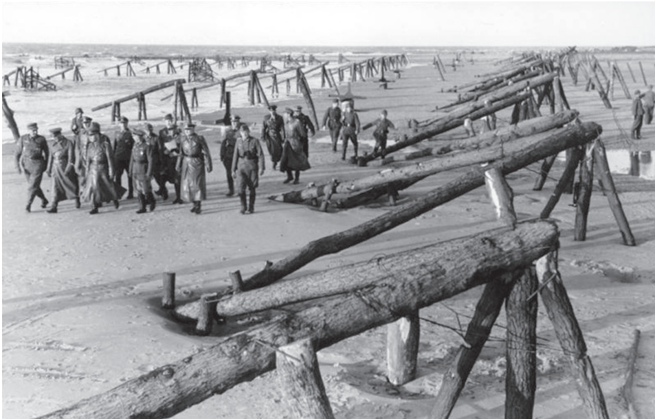
3. ábra. Rommel, a német csapatok parancsnoka megszemléli a tengerpartra telepített akadályokat

jén csak négy nap volt alkalmas az Overlordra.” A németek által a tengerpartra telepített műszaki akadályokkal apály idején kellett megbirkózni, amikor nem voltak víz alatt. Az ezt követően érkező, első partra szálló egységeknek viszont háromórás dagályra volt szükségük, hogy ne sártengeren keresztülgázolva kelljen partot érniük. A fentiek alapján a rohamra legkedvezőbb időpontok június 4-én 5:30, 5-én 6:10, 6-án 6:35, 7-én 7:15 voltak. Természetesen a szövetséges parancsnokságnak más szempontokat is figyelembe kellett vennie. Ahhoz, hogy a haditengerészet és a légierő bombázó tevékenysége érvényesülni tudjon, már legalább a hajnali szürkület világosságára volt szükség. Ezt is figyelembe véve a választás előbb június 5-re, végül június 6-ra esett.