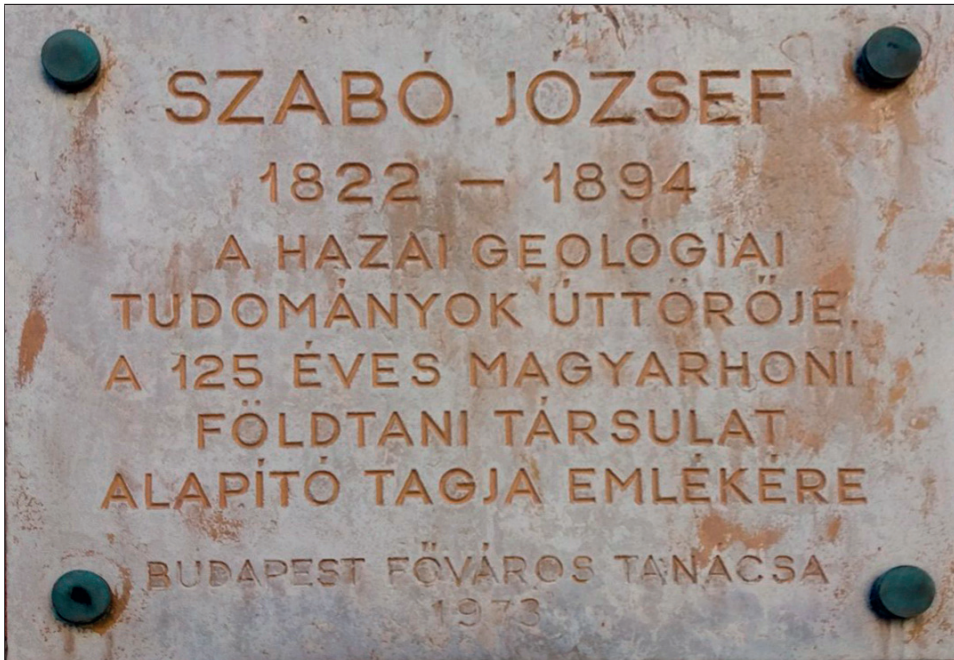
Emléktábla Budapesten a XIV. kerület Szabó József köz 2. szám alatt