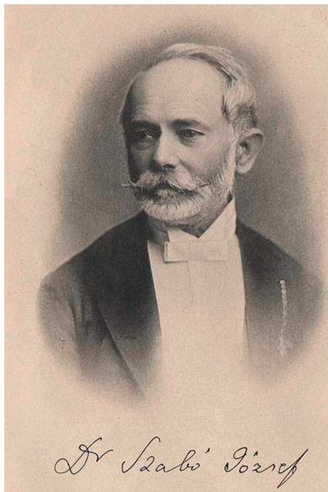
Szabó József (1822–1894) (Staub, 1895, 225., CC BY-SA 3.0 licenc)

A szókincs gyarapítására több, egymással vitázó álláspont is volt a korabeli Magyarországon. Egyesek erőltetetten gyártottak új szavakat, vagy a régies táj- és népi nyelvi szavakat emelték irodalmi szintre. Ugyancsak idetartoznak azok, akik az idegen szavakat átvették, vagy a már bevett idegen eredetűeket elfogadták.