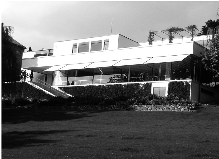
4. kép. A helyreállított épület a kert felől

és elképzelheti, hogy milyen lehetett itt élni. A körülötte már teljesen kiépült lakónegyedben más lett a pozíciója, mint volt, a semlegesnek ható utcai homlokzat távolságtartást és befelé fordulást sugall.