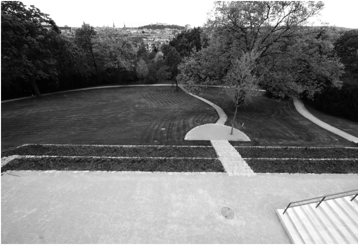
1. kép. Kilátás a városra a nappaliból

Mai szemmel nézve ez az ingatlan értékesebb része, innen rá lehet látni az egész belvárosra, de 1928 körül a Cerná Pole-negyed még csak éppen elkezdett kiépülni, divatossá csak körülbelül egy évtizeddel később vált. Az egyébként inkább zárt karakterű utcai főhomlokzatot is részben a kivételesen szép panoráma határozta meg, ezért is lehet átlátni a lapostetővel összefogott két tömeg között (a kisebb, majdnem az oldalhatáron álló épület a személyzeté volt).