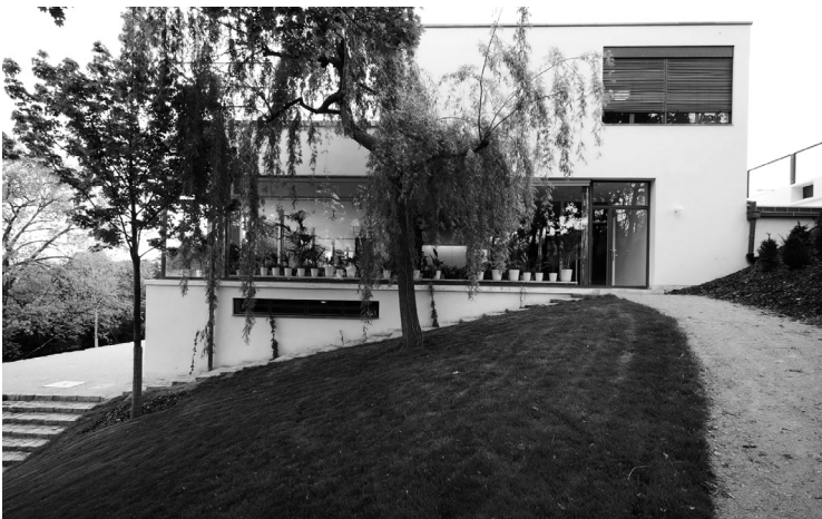
3. kép. Oldalhomlokzat a növényházzal (fotó: Dobai János)

Mindezen érdekem ellenére a kortárs cseh építészeti szaksajtó (például Jaromír Krejcar és Karel Teige) vagy tüntetően nem vett tudomást a villáról, vagy meglepően erős negatív véleményt fogalmazott meg. Külön hűtött szoba szolgált az értékes bundák tárolására, a szellőztető rendszerben szűrt és szantáloalajjal illatosított levegő keringett.