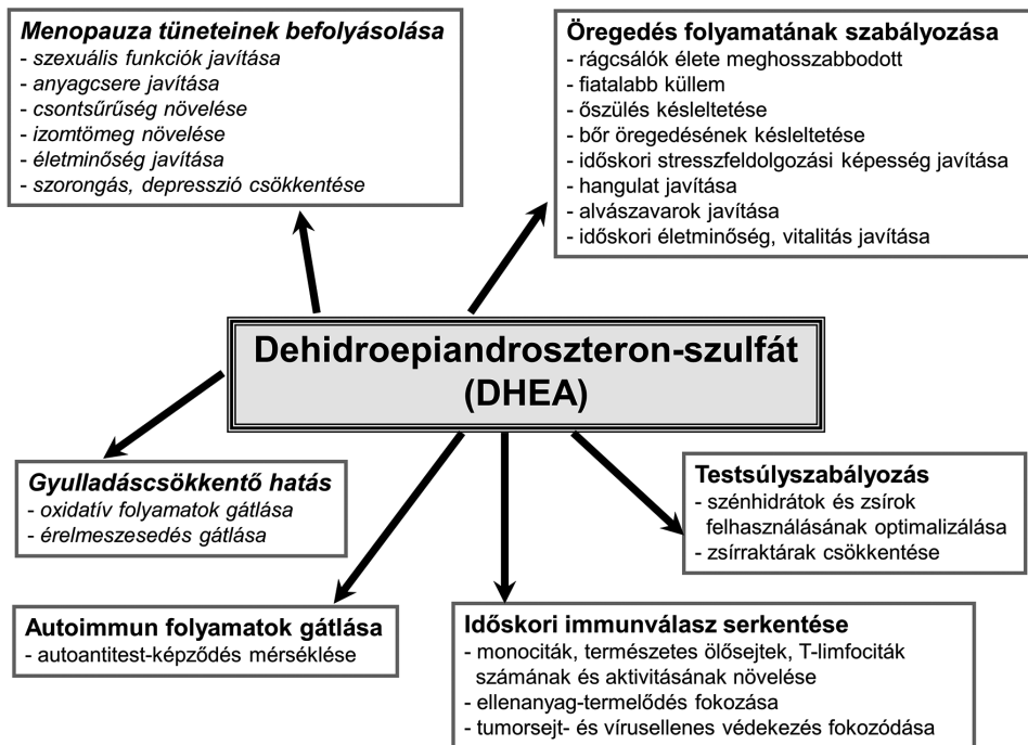
2. ábra. A dehidroepiandroszteron (DHEA) lehetséges hatásai emberben és rágcslókban (saját szerkesztés)

A DHEA lehetséges szerepe számos élettani folyamat szabályozásában felmerült (2. ábra). Kedvező anyagcserehatásai között leírták, hogy a glükóz-6-foszfát dehidrogenáz (G6PD) enzim gátlásán keresztül befolyásolja a szénhidrát és zsírok felhasználását, csökkenti a zsírok raktározását (Sahu et al., 2020). Lehetséges gyulladáscsökkentő hatásán keresztül gátolhatja az érlemezésedés folyamatát, ezáltal csökkentheti a szív-érrendszeri betegségek kockázatát. Egyes megfigyelések szerint csökkent DHEA-szint gyakrabban társult halálos kimenetelű szívinfarktushoz (Rutkowski et al., 2014; Sahu et al., 2020). Az alacsony DHEA-szintet szénhidrát-anyagcserezavarokkal is összefüggésbe hozták. Ismert, hogy cukorbetegségben a túlsúlyba kerülő oxidatív folyamatok számos szövődmény kialakul-