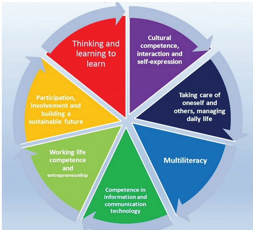
1. ábra. A keresztkompetenciák (Finnish National Agency for Education) (Az ábra szövege megegyezik a fentebbi felsorolásával.)